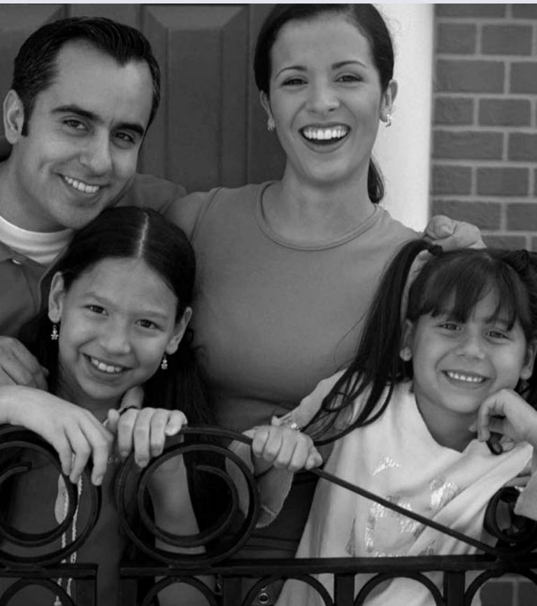
East Lake Street | Minneapolis