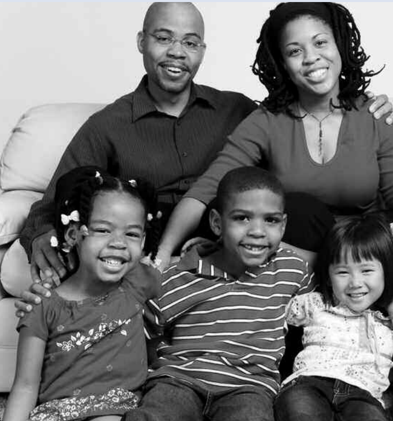
Shingle Creek Parkway | Brooklyn Center